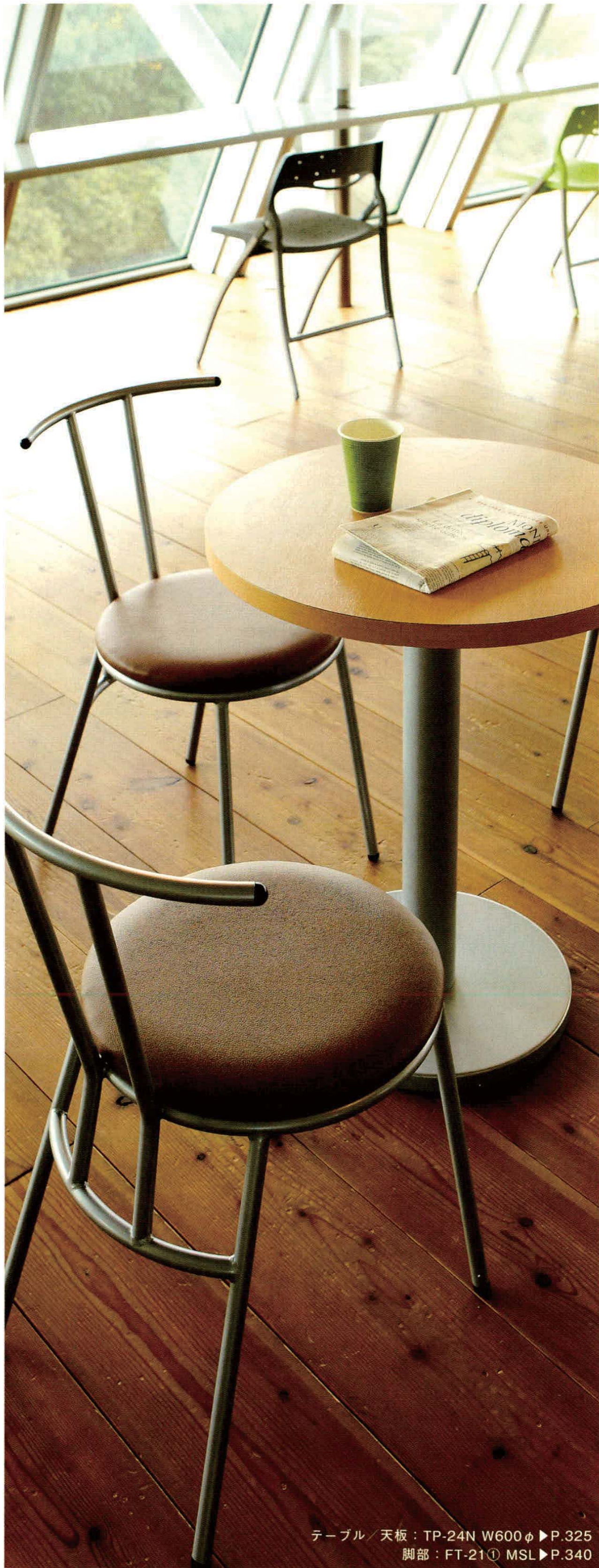
テーブル/天板: TP-24N W600φ ▶ P.325 脚部: FT-21① MSL ▶ P.340