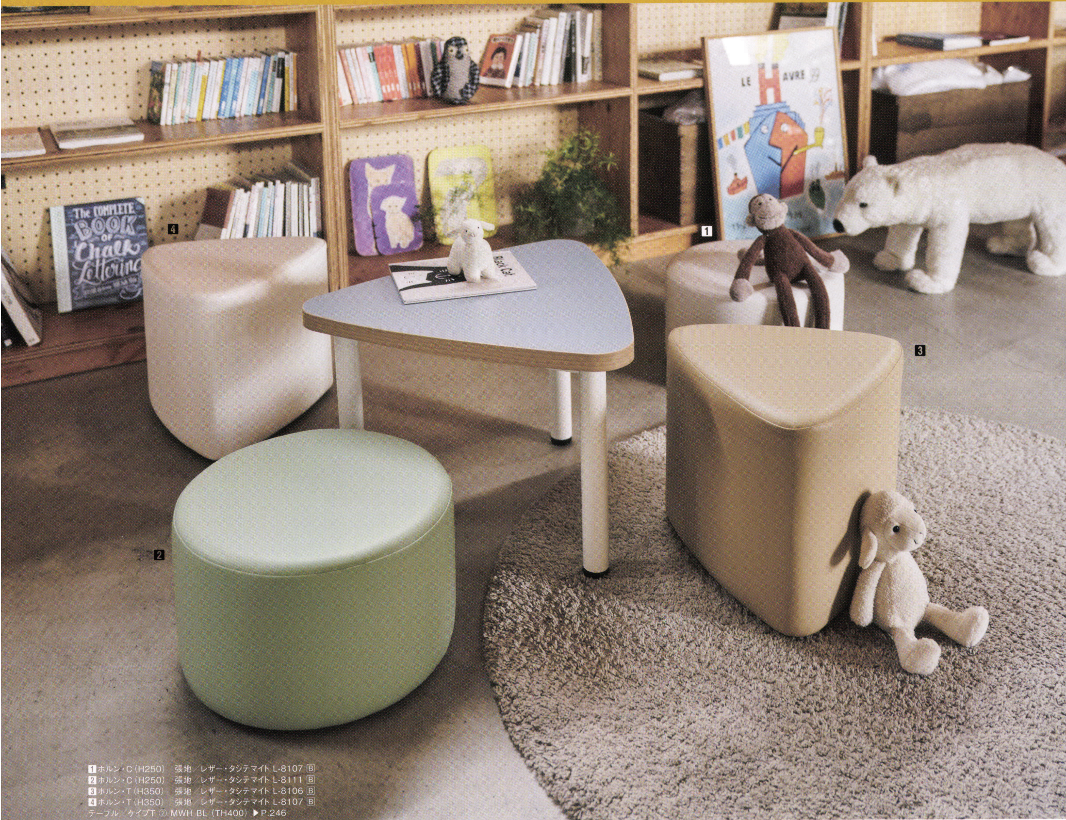
1 ホルン・C (H250) 張地 / レザー・タシテマイト L-8107 回 2 ホルン・C (H250) 張地 / レザー・タシテマイト L-8111 回 3 ホルン・T (H350) 張地 / レザー・タシテマイト L-8106 回 4 ホルン・T (H350) 張地 / レザー・タシテマイト L-8107 回 テーブル / ケイブT ② MWH BL (TH400) ▶ P.246