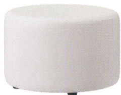
ホルン・C (H250) 張地 / レザー・タシテマイト L-8107 回

H250~350のオーダースツールで、幅広い年齢に対応できるように設計。どの向きからも座れるので、子どもの遊び心と発想によって空間を遊び場に変えられるような商品です。