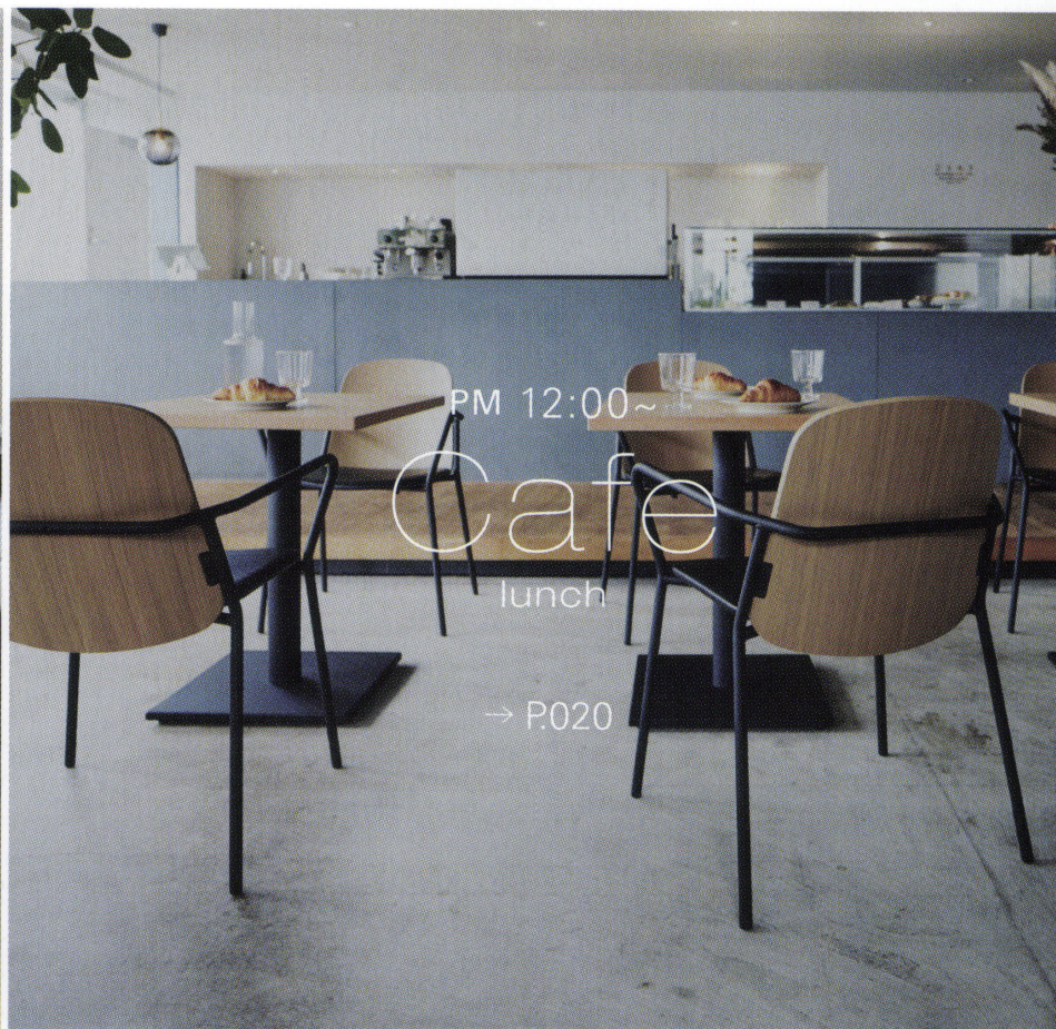
PM 12:00~ Cafe lunch → P.020