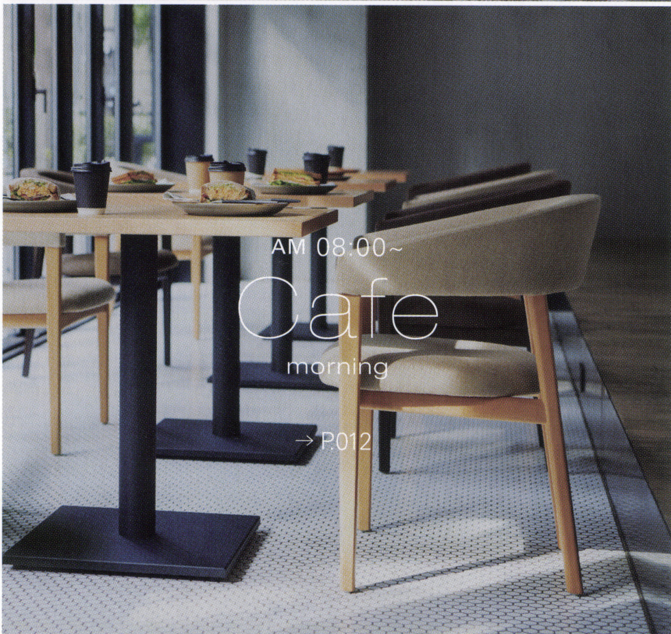
AM 08:00~ Cafe morning → P.012