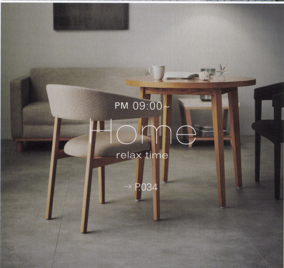
PM 09:00~ Home relax time → P.034