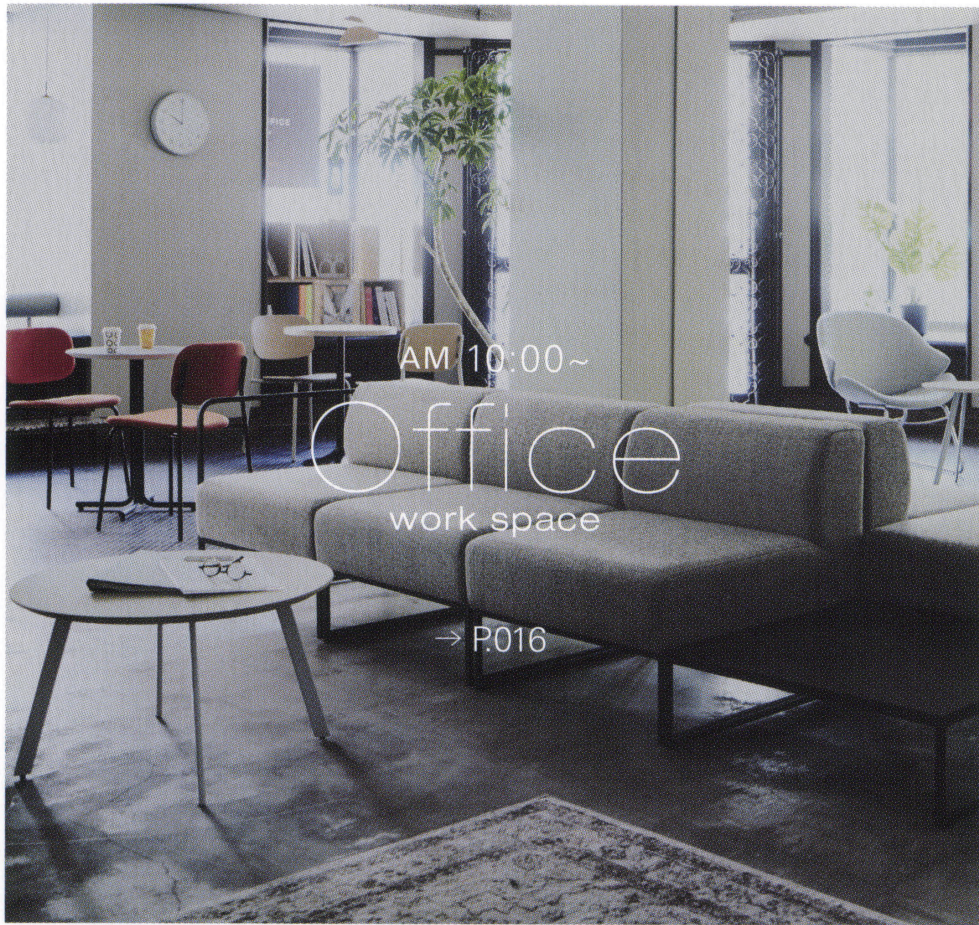
AM 10:00~ Office work space → P.016