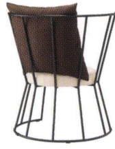
エピゾ MBK ¥133,900 (ツートン張) 張地 座 / 布・エイガ T-9200 ☐ 背クッション / 布・シグネイチャー T-9226 ☐