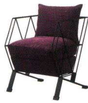
ルチル MCL ¥244,600 (ツートン張) 張地 座 / 布・エイガ T-9201 ☐ 背クッション / 布・パスタ T-9230 ☐