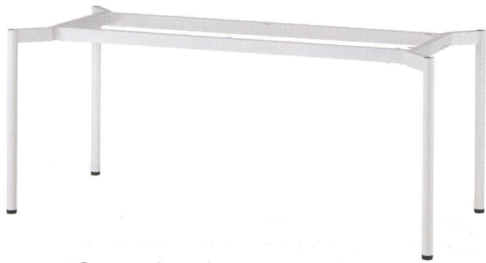
FT-416 ① MWH (H700)