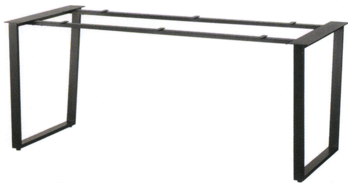
FT-417 ② MBK